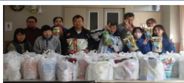
沢山洗剤を頂きました！