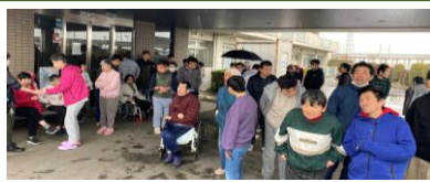
雨の中、夜間想定訓練を実施しました！