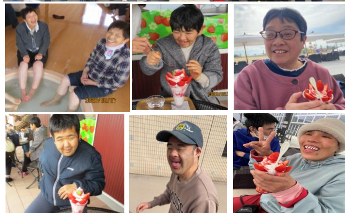
渋川方面に行ってきました！