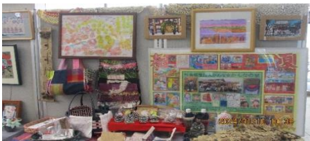
ゆうあいフェスティバル 展示