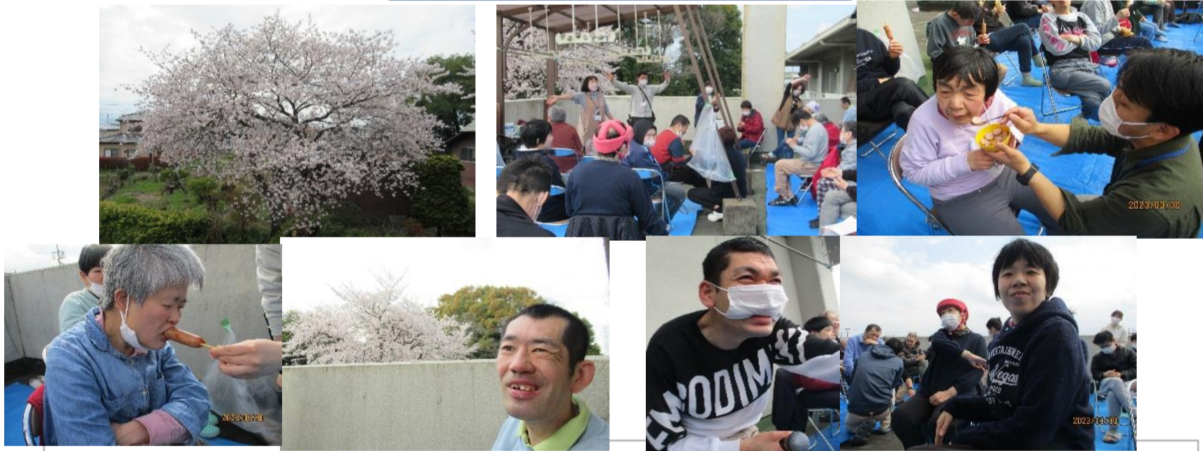
今年も満開の桜を見る事が出来ました。花見を楽しみながら、食事やカラオケをしたので、楽しい時間を過ごす事が出来ました。

社会福祉法人かな会 障害者支援施設 かなの里 〒375-0014 藤岡市下栗須887-1 TEL 0274-24-5885 FAX 0274-24-6855 E-mail kannakai-98@triton.ocn.ne.jp