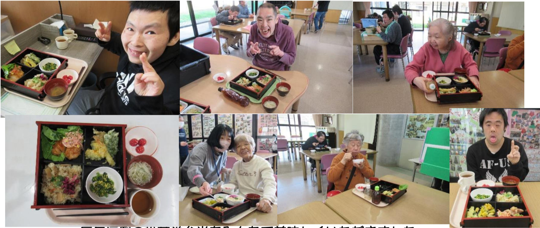
毎年恒例の松花堂弁当をみんなで美味しくいただきました。