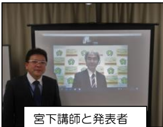
宮下講師と発表者