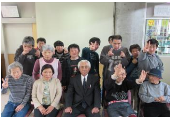
開所からの利用者さん